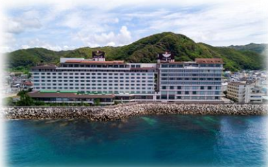
三日月シーパークホテル安房鴨川