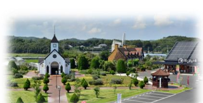
ローズマリー公園