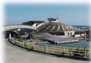
オーシャンパーク