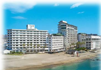
三日月シーパークホテル勝浦