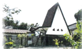
亀山湖水亭嵯峨和