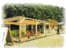
市原みつばち牧場

公共交通機関が限定された地域 ですので、 最終便に乗り遅れてしまうと各施設に取り残されてしまいます。特に14:40以降はくれぐれもご注意ください。 (当日の最終便以後、 ご出発場所への送迎は一切出来ません。 地元タクシー等をご自身で手配頂くなどの形となります為、事前に綿密なご計画をお願いすると共に、あらかじめご了承ください。)